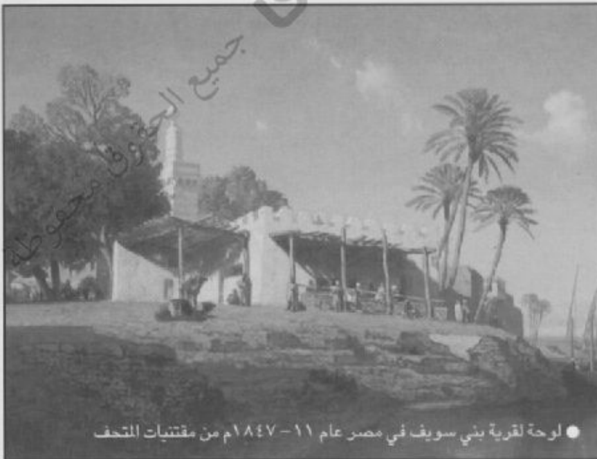
● لوحة لقريّة بني سويف في مصر عام ١١-١٨٤٧م من مقتنيات المتحف

لقد احتوى بيت هارتفورد على مئات اللوحات الأصلية ومئات الأسلحة والدروع والساعات التاريخية والمخطوطات، وهو منسق ومنظم بطريقة علمية دقيقة وجميلة مفرحة للبال والصدر وفي موقع طيب حيث الحديقة المقابلة له ومساحته الكبيرة وأدوار مبناه أهلتها لأن يحتوي أغلب المقتنيات فيه بترتيب محكم. ■