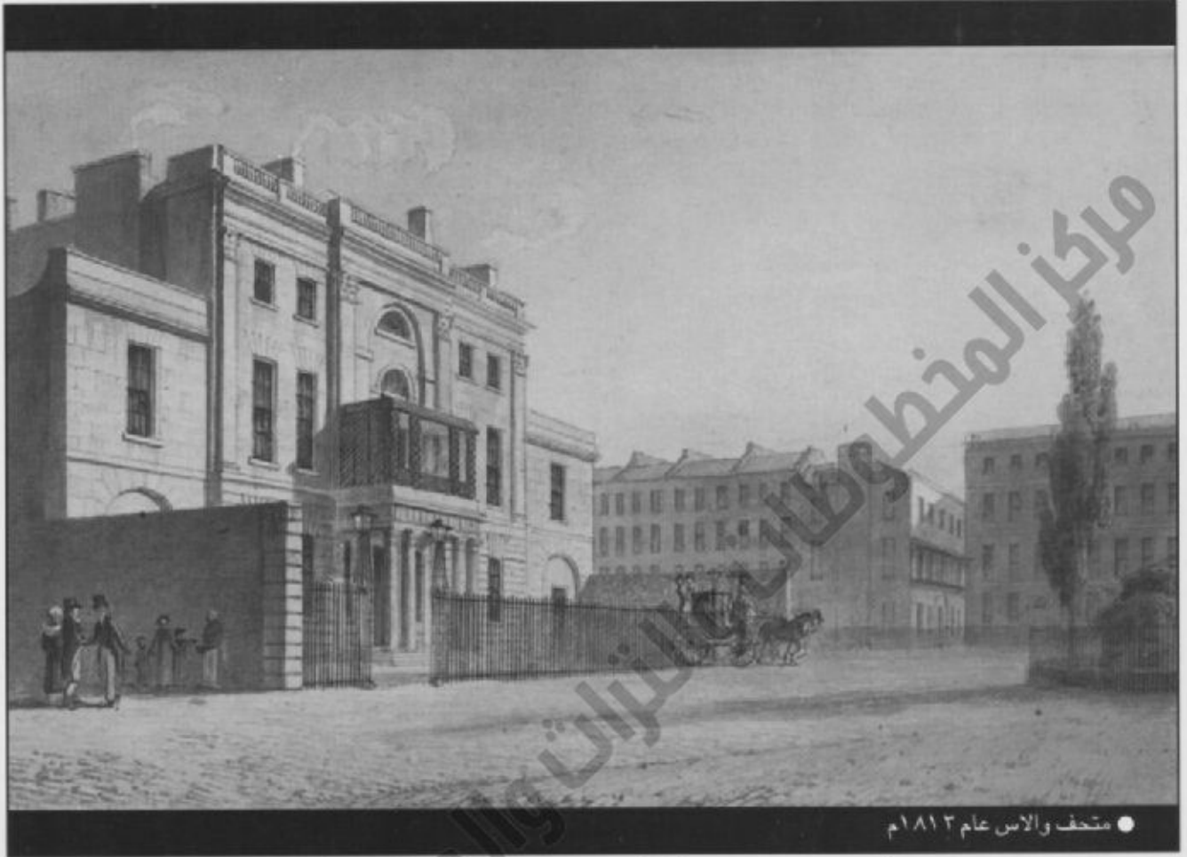
● متحف والاس عام ١٨١٣م