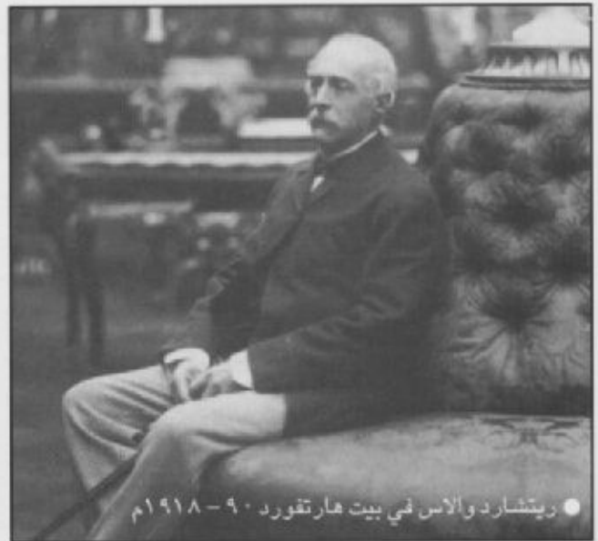
● ريتشارد والاس في بيت هارتفورد ٩٠ - ١٩١٨م

من عاداتي في سفراتي منذ عام ١٩٦٤ الأترك الذهاب إلى المتاحف والمعارض وأسواق الانتيك ومحلاتها والأسواق التي تقام مرة في الأسبوع في المحافظات والمدن والقرى في البلد التي أحل بها. إنها بالنسبة لي متعة أي متعة فهي لي كعلاج وعقاقير من كل مرض ونازلة فأكثر أحياناً أقضيها في مركزي «مركز المخطوطات والتراث والوثائق» بالجابرية وحزني حين أفارقه لرؤى الأولاد - وهو واجب من الواجبات - آخر النهار والاجتماع بهم ثم الأكل والنوم.