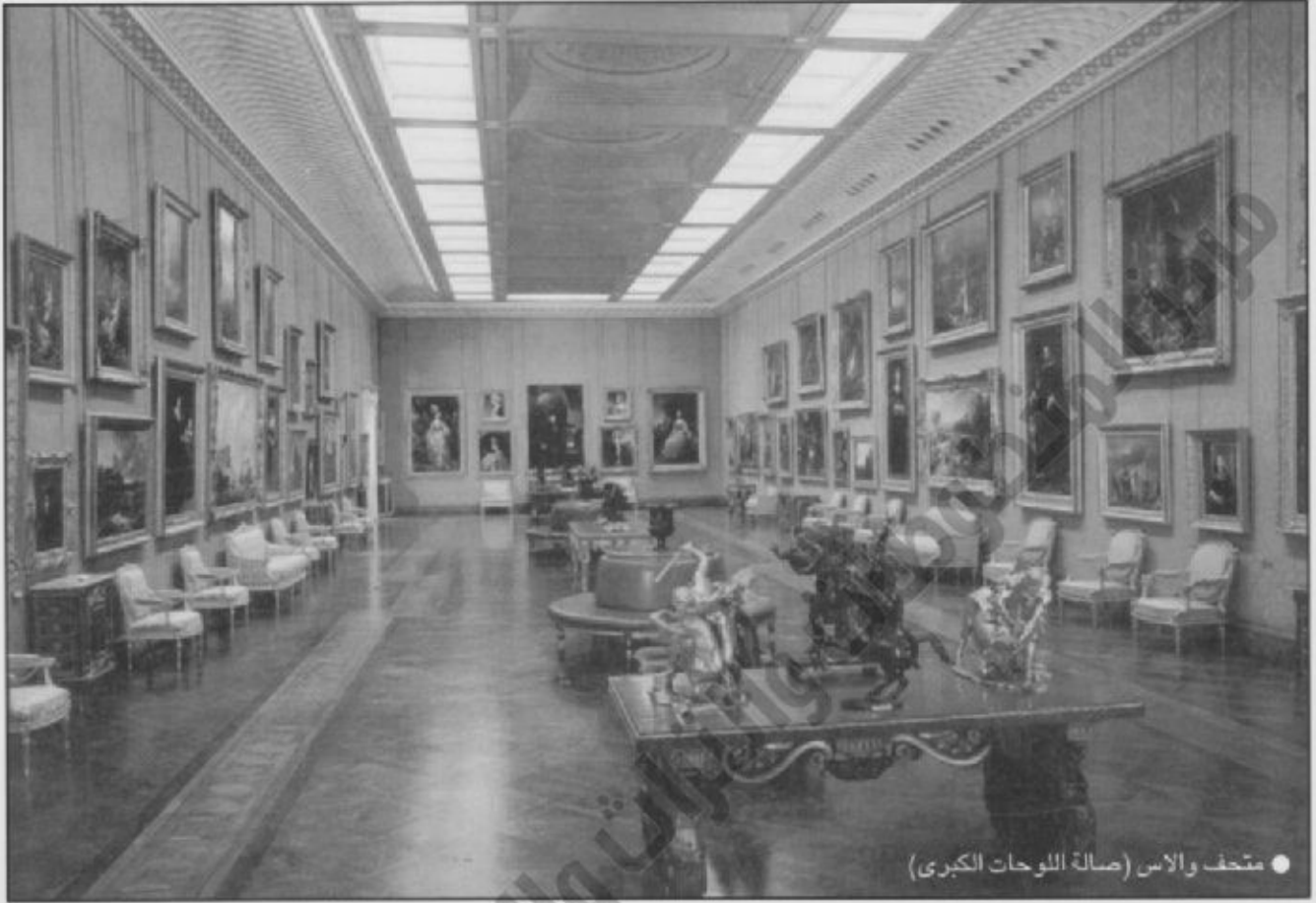
● متحف والاس (صالة اللوحات الكبرى)